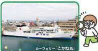
カーフェリー「こがね丸」