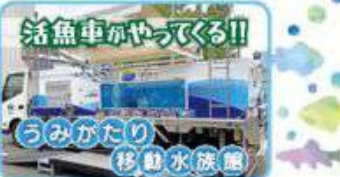
うみがたり 移動水族館